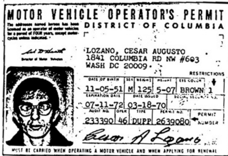
(S97-1b) Permis de conduire de "César"