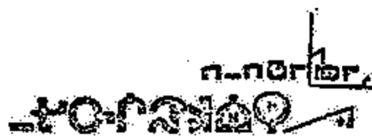
(S84-1 en tête de la version française)